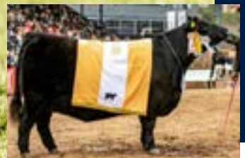
Tercer Mejor Hembra Palermo 2023

F. Nac.: 08/04/2023 RP: 1832 HBA: 902670