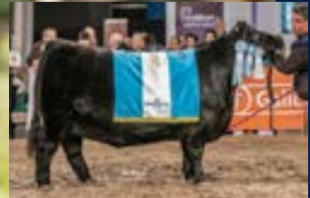
Gran Campeona de Otoño y Suprema de Otoño 2023