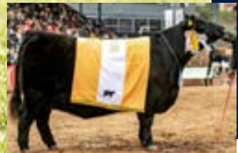
Tercer Mejor Hembra Palermo 2023

F. Nac.: 07/04/2023 RP: 1830 HBA: 902669