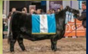
Gran Campeona de Otoño y Suprema de Otoño 2023